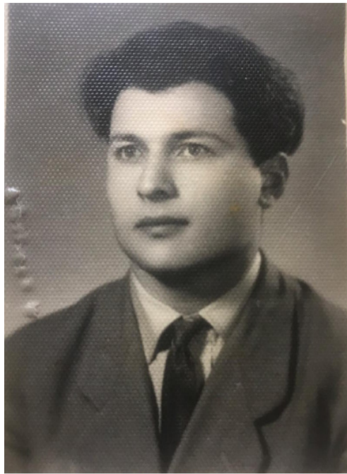
Сачыма бахды, күлдү, Јахды атәшә мени.

Бир гыз гаршыдан кәлди, Јанмыш јаман кәзәлди.