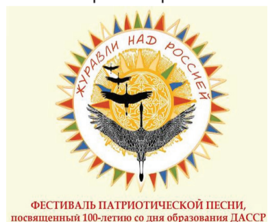
ФЕСТИВАЛЬ ПАТРИОТИЧЕСКОЙ ПЕСНИ, посвященный 100-летию со дня образования ДАССР

Бу һагда информәсија акедлијинө Республика Халг Јарадычылыгын Евинин мөтбуат хидмөтинөн мөлумат вермишләр.