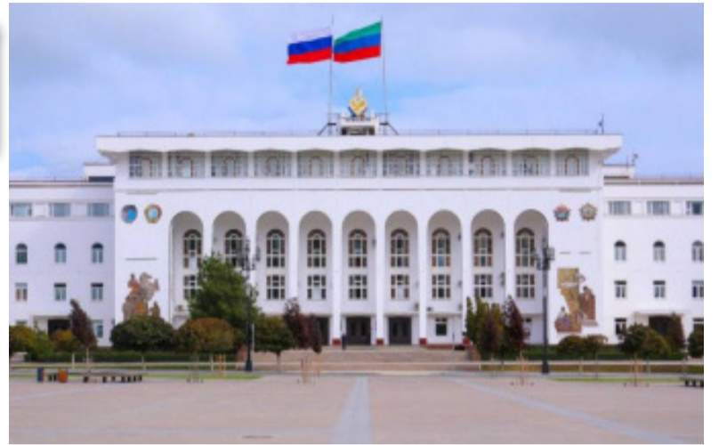
иштирак едән һәр кәсә сағ ол дејирәм» дејә республика башчысы вургулајыб. «Дағыстан» РИА

««Биркә һүчүм» нәтичәсиндә проблем һәлл едилиб. Базар күнләри ДР тәбиәт назирлијинин әмәкдашлары нәтичәләри арадан галдырыб. Нәглијат назирлији 15 әдәд техника ајрыб. Көрүндүјү кими бајрам күнләринә зибил өзбашналығынын истәмәјән инсанлар садәчә Аллаһ горхусу оланлардыр. Бурада